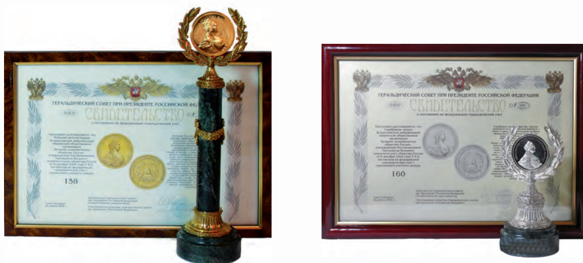
Современные награды ВЭО России — Большая золотая медаль и Серебряная медаль — зарегистрированы Геральдическим советом при Президенте Российской Федерации и поставлены на федеральный геральдический учет.