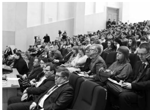
The participants of the conference, Oryol Участники конференции, г. Орёл

В своём докладе С.Ю. Глазьев говорил о неотложных мерах по укреплению экономической безопасности России и выводу российской экономики на траекторию опережения развития. Он доказывал не-