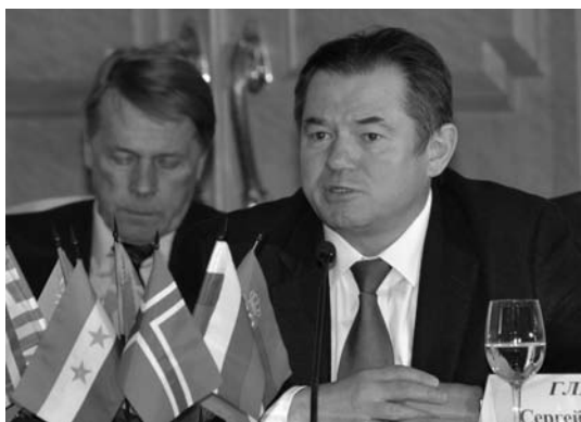
S.Yu. Glaziev is giving his speech Выступает С.Ю. Глазьев

«The modern civilization has reached its growth limits», said President of the International Union of Economists, Chairman of the Senate (Council of Elders) of the VEO of Russia, Honorary President of the VEO of Russia, President, Honored Academician of the International Academy of Management, RANS Academician, Dr. Sc. (Econ.), Professor Gavril Kharitonovich Popov who made a report on the topic: «Great Alternative of the 21st Century». The world is facing a range of problems that need global solutions. They are inequality, growing population (and not in the most trouble-free regions), international conflicts, growing consumption level and the threat of a shortage of resources, polluting the planet with hazardous waste and changing climate. It will hardly be possible to solve them within the framework of the existing socio-economic system, as «the main principle of equality, majority voting, will soon cease to be a tool of progress», G.Kh. Popov emphasized. In order to tackle global challenges effectively, mankind will have to consciously change the vector of civilization development.