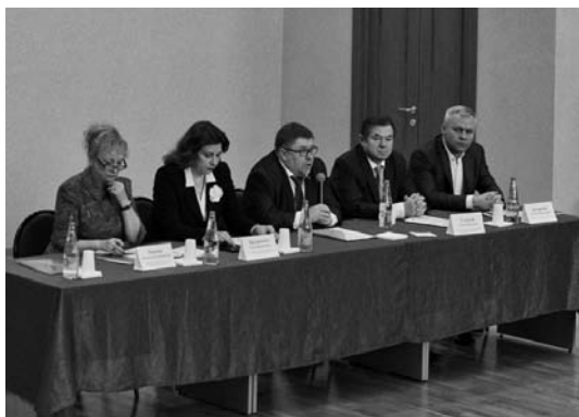
Presidium conference, Oryol Президиум конференции, г. Орёл

Organizers: Oryol Regional Branch of the Free Economic Society of Russia, Administration of Oryol Region, I.S. Turgenev Oryol State University, Prioksky State University, Oryol Branch of the Izborsk Club.