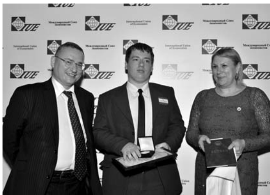
Awarding of the laureates of contest D.A. Lobes Награждение лауреата конкурса Д.А. Лобеса

In compliance with the conditions of the Contest of Scientific Works among the students of the higher educational institutions of Russia, the winner taking the first place receives an excellent mark in economic disciplines at entrance examinations to the postgraduate courses of the RAS Institute of Economics. The winners of the Contest of Youth's Scientific Works among the students of the higher educational institutions of Russia have preferences when entering the postgraduate courses and master's degree program of State Budgetary Educational Institution of Higher Professional Education Financial University under the Government of the Russian Federation.