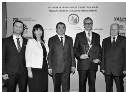
Awarding staff Tula regional branch of LLC «Insurance Company» (in the nomination «Team of the Year») Награждение коллектива Тульского регионального филиала ООО «Страховая Компания «Согласие» (в номинации «Команда года»)

В связи с 20-летием Международной Академии менеджмента 7 победителей конкурса «Менеджер года» награждаются юбилейным дипломом «За значительный вклад в развитие экономики и менеджмента».