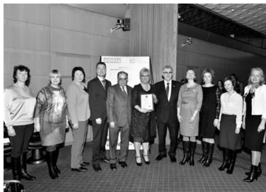
Awarding staff Scientific-practical center of medical and social rehabilitation of the disabled named L.I. Shvetsova (in the nomination «Team of the Year») Награждение коллектива Научно-практического центра медико-социальной реабилитации инвалидов имени Л.И. Швецово (в номинации «Команда года»)

Состав участников конкурса по итогам 2015 года отражает изменения, происходящие в экономике столицы. Значительное число победителей представляют строительство, транспорт, жилищно-коммунальное хозяйство и, особенно, социальную сферу, что свидетельствует о повышенном внимании Правительства Москвы к наиболее важным сферам жизнедеятельности мегаполиса.