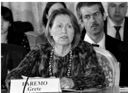
Grete Faremo is giving his speech Выступает Фаремо Грете

«Today, competition in global hi-tech markets rather involves not countries, but consortiums and added value chains». It is important that the links of these chains and the centers of their system integration should move to our territory. The final goal of innovative growth, national competitiveness is to retain highly skilled and highly paid jobs on one's own territory. No growth in living standards and quality of life is possible without that».