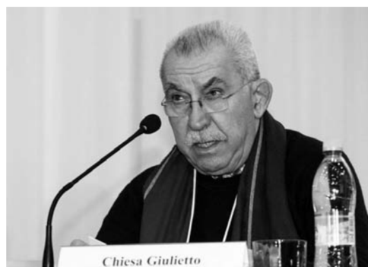
Выступает Джульетто Кьеза Giulietto Chiesa is giving his speech

Первая пленарная сессия — « Обновление российской экономики: цели и средства » — задала тон всему остальному ходу конгресса. На ней были поставлены наиболее острые и принципиальные вопросы решительного технологического прорыва в будущее, перемены вектора экономической политики для преодоления деиндустриализации экономики России и обеспечения реального приоритета росту знаниеёмкого высокотехнологичного материального производства.