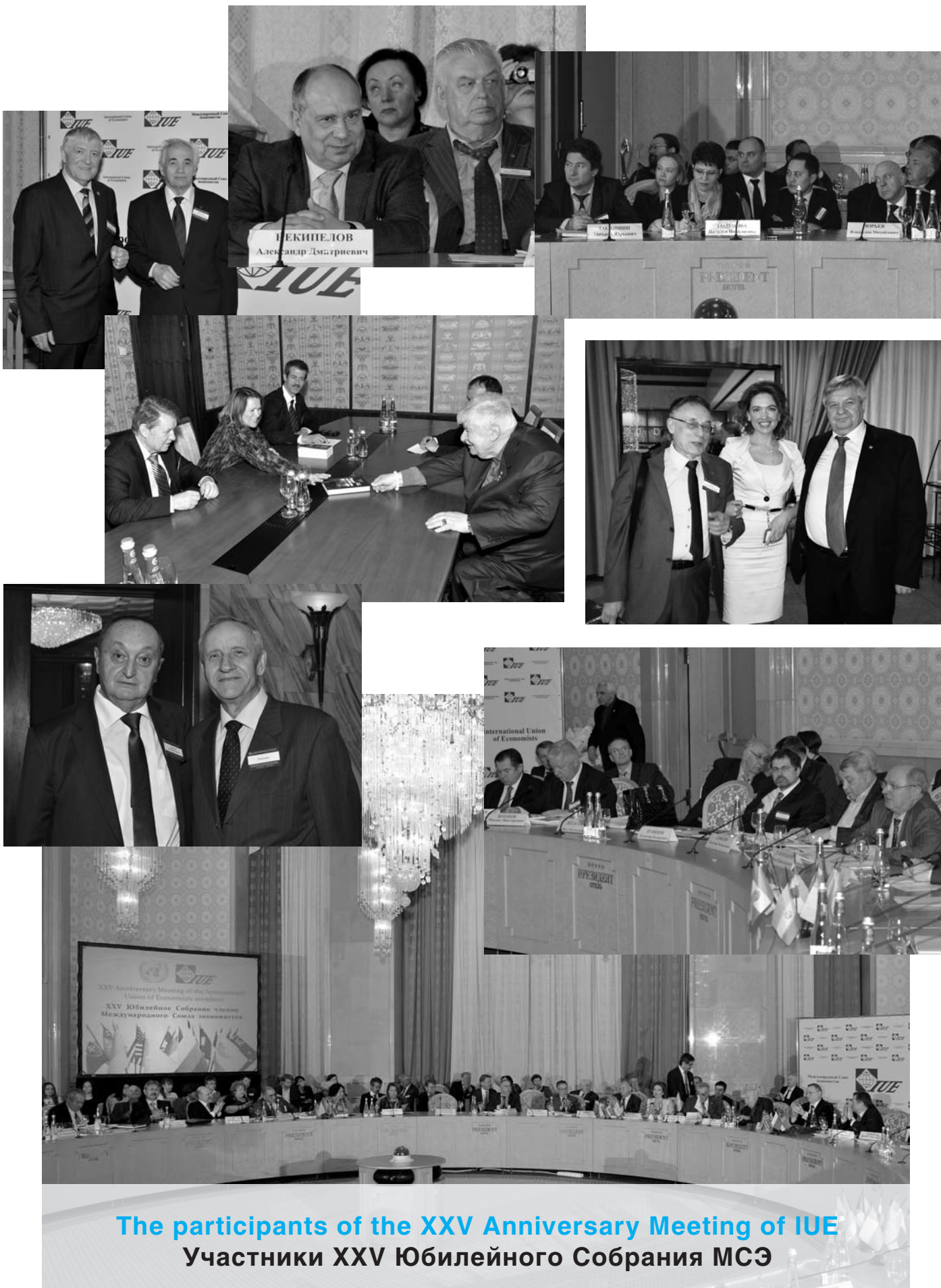
The participants of the XXV Anniversary Meeting of IUE Участники XXV Юбилейного Собрания МСЭ