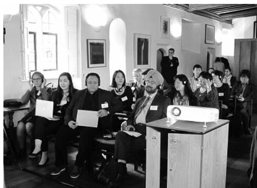
Participants of the seminar Conceptualizing Development and Cooperation in Eurasia Участники семинара «Концептуализации развития и сотрудничества в Евразии»

На первой сессии «Концептуализация Евразии и ее развития» с центральным докладом «К новому качеству материального производства: будущее России в Евразийском пространстве» выступил Президент ВЭО России С.Д. Бодрунов; докладчик отметил, что равноправное экономическое и политическое международное сотрудничество возможно только при взаимной заинтересованности и при близком экономическом потенциале. России, чтобы стать равноправным экономическим партнером, необходимо, избавившись от нынешней превалирующей роли поставщика сырья, выйти на передовой уровень технологического развития. Это, как сказано в докладе, возможно только за счет перехода на новую ступень индустриального развития, и именно такой переход и является условием более эффективного участия России в глобальной и, в частности, евразийской экономической кооперации.