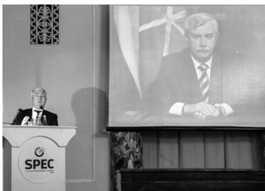
Special representative of the Governor of St. Petersburg on economic development A.I. Kotov is giving his speech Выступает А.И. Котов, специальный представитель губернатора Санкт-Петербурга по вопросам экономического развития

The Forum's agenda was very ambitious. The work of the Congress included two plenary sessions, three conferences, four workshops and nine round tables. Over 500 people were registered as attendees at the very start, while eventually the number of participants exceeded 600 people. The Grand Conference Hall of RAS Saint Petersburg Academic Center located in Universitetskaya Embankment, where the first two sessions of the plenary meeting took place, could not even house all those who wanted to attend them.