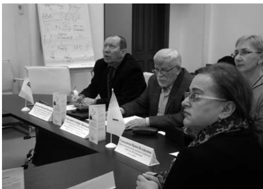
Presidium conference, Arkhangelsk Президиум конференции, г. Архангельск