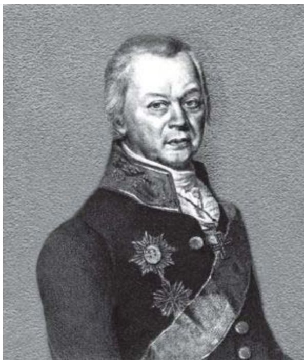
А. А. Нартов

(медицина, гигиена, санитария, ветеринария). Огромная библиотека (ее собрания вошло в состав Российской Национальной библиотеки) дополнялась музеем моделей, механической мастерской и минералогическим кабинетом, где собирались образцы «ископаемого царства»