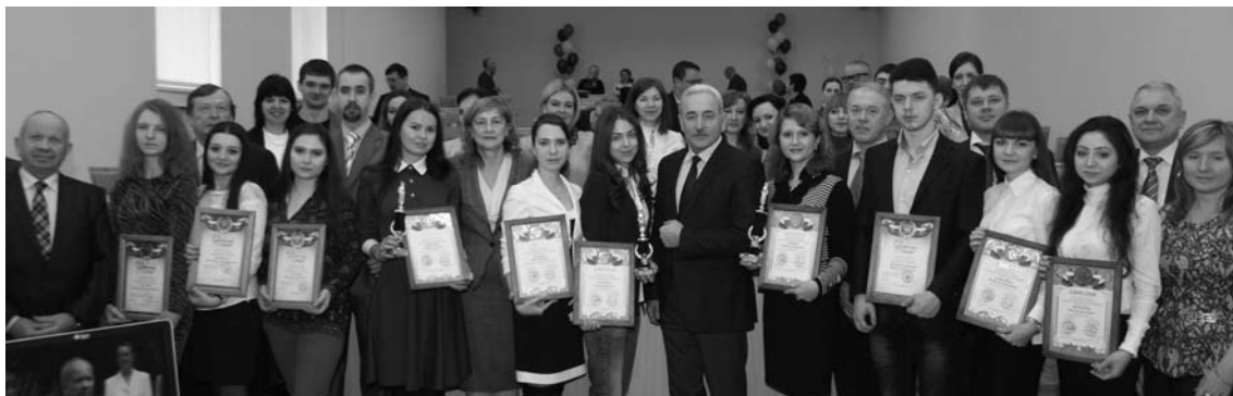
Awards for achievements in research activities handed out to postgraduates, young scientists and students. Вручение наград за достижения в научно-исследовательской деятельности аспирантам, молодым ученым и студентам