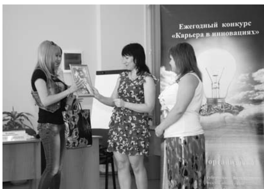
The absolute winner being awarded Награждение абсолютного победителя конкурса

Objectives of the contest: expert examination of commercial offers for innovative projects, engaging professionals and young participants in innovation development process, identification of the best contestants.