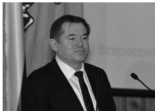
S.Yu. Glaziev is giving his speech Выступает С.Ю. Глазьев