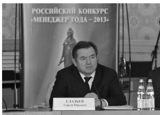
S.Yu. Glaziev is giving his speech Выступает С.Ю. Глазьев

The competition for the «Manager of the Year» title attracted the applicants from foreign countries as well — namely Belarus, Kazakhstan and China. They competed in the International Cooperation nomination.