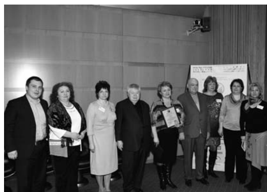
Awarding in the nomination Team of the Year Вручение наград в номинации «Команда года»

Информационную поддержку обеспечивали: телеканалы «Москва 24», «Подмосковье»; журналы «Наша власть: дела и лица», «Босс», «Менеджмент и бизнес-администрирование», «Генеральный директор», «Предпринимательство»; газеты «Экономика и жизнь», «Экономические новости России и Содружества», «Тверская, 13», «Вечерняя Москва», «Московская правда», «Сорок один».