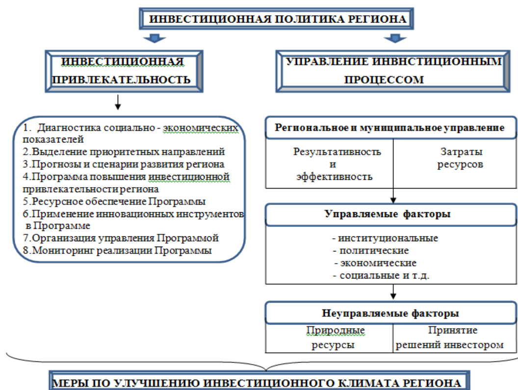
Рисунок 3 – Макет комплексной программы по привлечению инвестиций в Орловскую область (разработан автором)

Одним из важнейших мероприятий по модернизации инвестиционной политики региона является разработка комплексной программы привлечения инвестиций, который включает не только действия по продвижению региона, но и комплекс практических мероприятий по созданию инфраструктуры поддержки инвестиций. Краткое содержание разработанной программы по привлечению инвестиций в Орловскую область представлено на рисунке 3.